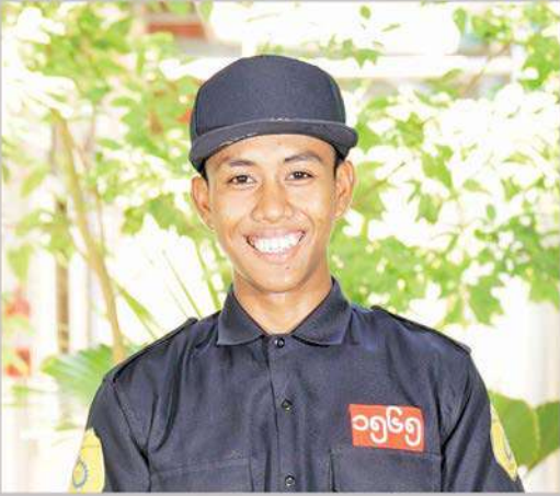
မောင်သူထူးစံ မန်းကျီးကျေးရွာ အမှတ် (၅) စက်မှုသင်တန်းကျောင်း (မကွေး)

လုပ်ဆောင်နိုင်ပါစေလို့ ကျွန်တော့်အနေနဲ့ ဆုတောင်းပေး ပါတယ်။ ကျွန်တော်တို့ကို အခုကို ပညာသင်ကြားပေးတဲ့ အတွက်လည်း MPRL E&P ကုမ္ပဏီကို ကျေးဇူးအထူးတင် ပါတယ်။ ကျွန်တော် အလုပ်ရပြီး လစာဝင်ငွေတွေရလာ တဲ့အခါ ဒေသကို တစ်ဖက်တစ်လမ်းက ပြန်လည်အကျိုး ပြုမယ်လို့ ဆုံးဖြတ်ထားပါတယ်။”