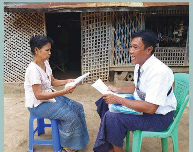
အွန်လိုင်းအင်္ဂလိပ်စာသင်တန်းထိရောက်မှုနှင့် နည်းပြများ၏စွမ်းဆောင်ရည်တို့ကို ဆန်းစစ်နိုင်ရန် သင်တန်းသားများနှင့် မိဘများထံမှ သဘောထားမှတ်ချက်ကောက်ယူခြင်း