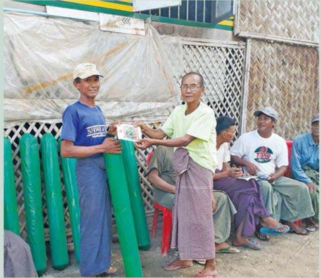
စိုက်ပျိုးရေးသွင်းအားစုများ ဖြန့်ဝေခြင်း