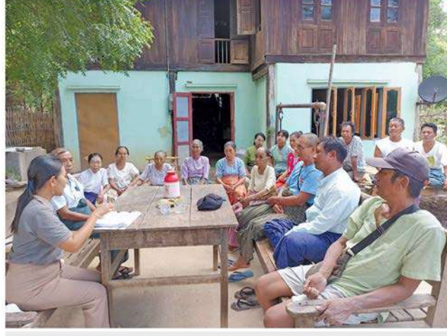
မျက်စိခွဲစိတ်ကုသမှုများ စတင်နိုင်ရန် သက်ဆိုင်ရာကျေးရွာအုပ်ချုပ်ရေးမှူး၊ ကျေးရွာဖွံ့ဖြိုးရေးကော်မတီဝင်များနှင့် ခွဲစိတ်ကုသမှုမည့် ဒေသခံများ၏ မိသားစုဝင်များနှင့်တွေ့ဆုံ၍ သဘောတူညီမှုရယူခြင်း