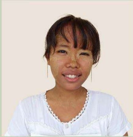
မနန်းရေန်ခိုင်

စကားရည်လှပိုင်ပွဲတွင် အလယ်တန်းအဆင့် ကျောင်းသား၊ ကျောင်းသူ (၁၂) ဦးကို တစ်ဖွဲ့လျှင် (၆) ဦးစီပါဝင်သည့် အဖွဲ့ (၂) ဖွဲ့ ခွဲ၍ ယှဉ်ပြိုင်ရမည့်အကြောင်းအရာကို မဲနှိုက်ရွေးချယ်ခဲ့ရာ အဖွဲ့(၁) က “ကျေးရွာအဆင့်တွင် ပလတ်စတစ်ပစ္စည်းသုံးစွဲခြင်းကို လုံးဝပျောက်အောင်လုပ်ဆောင်နိုင်သည်” ဟူသည့် ခေါင်းစဉ်ဖြင့်လည်းကောင်း၊ အဖွဲ့ (၂) က “ကျေးရွာအဆင့်တွင် ပလတ်စတစ်ပစ္စည်းသုံးစွဲခြင်းကို လုံးဝပျောက်အောင် မလုပ်ဆောင်နိုင်ပါ” ဟူသည့်ရှုထောင့်မှလည်းကောင်း စကားရည်လှပိုင်ပွဲသည် အဆိုပါအခမ်းအနားသို့ ကျောင်းသား၊ ကျောင်းသူများ၊ ဆရာ၊ ဆရာမများ