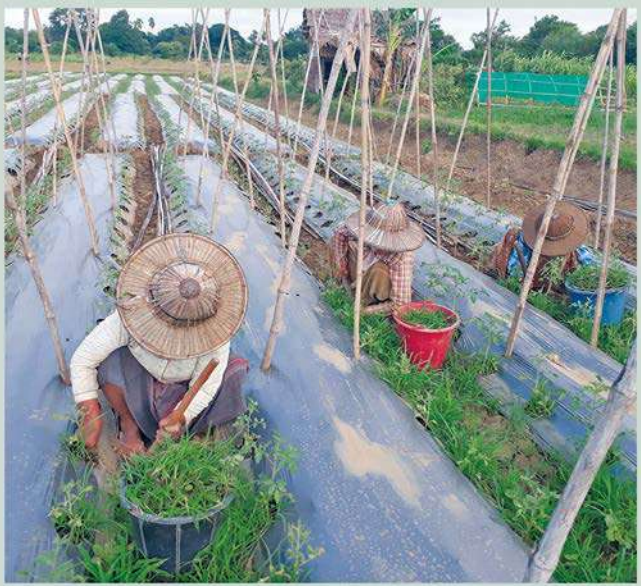
ခရမ်းချဉ်စိုက်ပျိုးထုတ်လုပ်မှုများကို စောင့်ကြည့်လေ့လာခြင်း

အလားတူ မန်းရေနံမြေတွင် စိုက်ပျိုးဖြစ်ထွန်းအောင်မြင်လျက်ရှိသည့် ခရမ်းချဉ်သီးနှံကို တိုးတက်ထုတ်လုပ်နိုင်ရန် ခရမ်းချဉ်စိုက်ပျိုးတောင်သူများ၏ ကြိုတင်ပြင်ဆင်မှုများကို စဉ်ဆက်မပြတ် စောင့်ကြည့်လေ့လာလျက်ရှိပြီး လိုအပ်သည်များကို CSR လုပ်ငန်းအဖွဲ့ဝင်များက ပံ့ပိုးလျက်ရှိသည်။ ၂၀၂၃ ခုနှစ်၊ ဇူလိုင်လအတွင်း အောက်ကျောင်းနှင့် မယ်ဘော့ကုန်းကျေးရွာတို့ရှိ ခရမ်းချဉ်တောင်သူ (၃၆) ဦးကို သီးသန့်စုစည်း၍ ရေတံခွန်တောင်သူပညာပေးအဖွဲ့ (ပွင့်ဖြူမြို့နယ်) ၏ အကူအညီဖြင့် ခရမ်းချဉ်စိုက်ပျိုးရေးဆိုင်ရာ ပိုးမွှားထိန်းချုပ်မှုနှင့် အပင်ရောဂါအမျိုးမျိုးတို့နှင့်