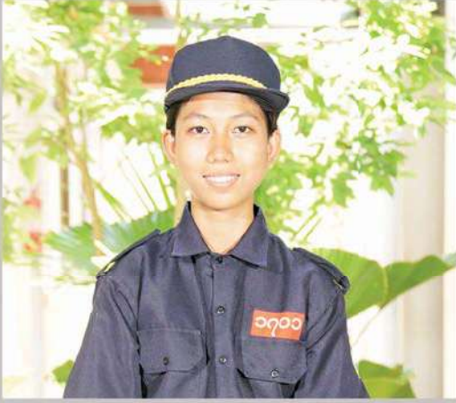
မဆုနန္ဒာ မယ်ဘော့ကုန်းကျေးရွာ အမှတ် (၅) စက်မှုသင်တန်းကျောင်း (မကွေး)

“ကျွန်မက အမှတ် (၅) စက်မှုသင်တန်းကျောင်း (မကွေး) ကို တက်ဖို့ ၂၀၂၃-၂၀၂၄ ပညာသင်နှစ်အတွက် ပညာသင်ဆုရ တဲ့ (၅) ဦးထဲက တစ်ဦးဖြစ်ပါတယ်။ ကျွန်မက မိန်းကလေးဆို ပေမယ့် မော်တော်ကားပြုပြင်ထိန်းသိမ်းမှု ဘာသာရပ်ဖြစ် တဲ့ Automobile Maintenance ဘာသာရပ်ကို စိတ်ဝင် စားတာကြောင့် ပညာသင်ဆုလျှောက်ဖြစ်ခဲ့တာပါ။ MPRL E&P ရဲ့ ပညာသင်ဆုက ကျွန်မရဲ့ ပညာသင်စရိတ်အခက် အခဲတွေကို ပြေလည်စေခဲ့ပါတယ်။ ကျွန်မလိုဘဲ ကျွန်မတို့ မယ်ဘော့ကုန်းကျေးရွာကနေ စိုက်ပျိုးရေးသိပ္ပံ (ပွင့်ဖြူ) မှာ ဒုတိယ နှစ်သင်တန်းတက်နေတဲ့ လူငယ်နှစ်ဦးလည်း ရှိပါတယ်။ MPRL E&P ရဲ့ ပညာသင်ဆုအစီအစဉ်က ကျွန်မတို့ မန်းရေနံ မြေဒေသခံလူငယ်တွေရဲ့ အနာဂတ်အတွက် အထောက် အပံ့ကောင်းတစ်ခုပါ။ ကျွန်မတို့ကို အခက်အခဲမရှိ ပညာ သင်ခွင့်ရစေတဲ့ MPRL E&P ကုမ္ပဏီကို ကျေးဇူးတင်တဲ့အနေ နဲ့ ဒီသင်တန်းကို စည်းမျဉ်း၊ စည်းကမ်းတွေနဲ့အညီ ကြိုးကြိုး စားစား တက်ရောက်သွားမှာပါ။”