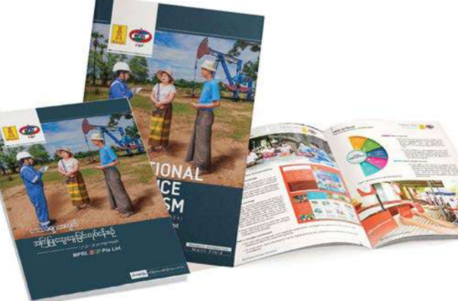
၂၀၂၃-၂၀၂၄ ဘဏ္ဍာရေးနှစ်၊ ပထမ သုံးလပတ်အတွင်း အသစ်ရေးသားတင်ပြခဲ့သည့် အကြံပြုဆွေးနွေးခြင်းဆိုင်ရာ သုံးလပတ်အစီရင်ခံစာ

MPRL E&P သည် လုပ်ငန်းလုပ်ကိုင်ရာဒေသရှိ ဒေသခံများ လုပ်ငန်းဆောင်ရွက်မှုနှင့် ဆက်စပ်သည့်ကိစ္စရပ်များနှင့် စိုးရိမ်မှုများရှိပါက တိုက်ရိုက်ဆက်သွယ်ပြောဆိုနိုင်မည့် နည်းလမ်းတစ်ခုအဖြစ် အကြံပြုဆွေးနွေးခြင်းလုပ်ငန်းစဉ်ကို ဆယ်စုနှစ်တစ်ခုစာအောင်မြင်စွာ လည်ပတ်လုပ်ကိုင်လျက်ရှိသည်။ လုပ်ငန်းစဉ်ဆိုင်ရာ အချက်အလက်များကို သတ်မှတ်ဘဏ္ဍာရေးနှစ်အတွင်း သုံးလတစ်ကြိမ် ပုံမှန်ပြုစုကာ အင်္ဂလိပ်၊ မြန်မာ နှစ်ဘာသာဖြင့် ကုမ္ပဏီဝက်ဘ်ဆိုဒ်တွင် ပုံမှန်တင်ပြအစီရင်ခံလျက်ရှိသည်။ ၂၀၂၃ -၂၀၂၄ ဘဏ္ဍာရေးနှစ်၊ ဒုတိယသုံးလပတ်အတွက် အကြံပြုဆွေးနွေးခြင်းလုပ်ငန်းဆိုင်ရာ သုံးလပတ်အစီရင်ခံစာကို အများသူငှာလေ့လာနိုင်ရန် ပြုစုတင်ပြထားပြီးဖြစ်သည်။ ■