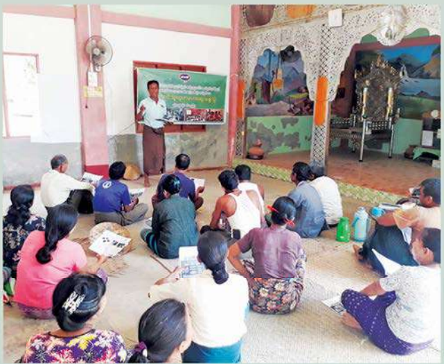
ရေတံခွန်တောင်သူပညာပေးအဖွဲ့ (ပွင့်ဖြူမြို့နယ်) နှင့် ပူးပေါင်း၍ တောင်သူပညာပေးဆွေးနွေးပွဲများကျင်းပပြုလုပ်ခြင်း

အလားတူ မန်းရေနံမြေတွင် စိုက်ပျိုးဖြစ်ထွန်းအောင်မြင်လျက်ရှိသည့် ခရမ်းချဉ်သီးနှံကို တိုးတက်ထုတ်လုပ်နိုင်ရန် ခရမ်းချဉ်စိုက်ပျိုးတောင်သူများ၏ ကြိုတင်ပြင်ဆင်မှုများကို စဉ်ဆက်မပြတ် စောင့်ကြည့်လေ့လာလျက်ရှိပြီး လိုအပ်သည်များကို CSR လုပ်ငန်းအဖွဲ့ဝင်များက ပံ့ပိုးလျက်ရှိသည်။ ၂၀၂၃ ခုနှစ်၊ ဇူလိုင်လအတွင်း အောက်ကျောင်းနှင့် မယ်ဘော့ကုန်းကျေးရွာတို့ရှိ ခရမ်းချဉ်တောင်သူ (၃၆) ဦးကို သီးသန့်စုစည်း၍ ရေတံခွန်တောင်သူပညာပေးအဖွဲ့ (ပွင့်ဖြူမြို့နယ်) ၏ အကူအညီဖြင့် ခရမ်းချဉ်စိုက်ပျိုးရေးဆိုင်ရာ ပိုးမွှားထိန်းချုပ်မှုနှင့် အပင်ရောဂါအမျိုးမျိုးတို့နှင့်