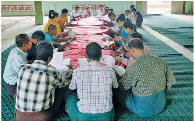
လာမည့်နှစ်ဦးရာသီတွင် ရှင်ပြုအလှူမင်္ဂလာပွဲ ကျင်းပနိုင်ရေးအတွက် ကျေးရွာ (၁၄) ရွာရှိ အုပ်ချုပ်ရေးမှူးများ၊ ကျေးရွာဖွံ့ဖြိုးရေးကော်မတီဝင်များနှင့် CSR လုပ်ငန်းအဖွဲ့ဝင်များ တွေ့ဆုံဆွေးနွေးခြင်း

အလားတူ CSR လုပ်ငန်းဆောင်ရွက်ချက်ဆိုင်ရာ အပတ်စဉ်နှင့် လစဉ်အစီရင်ခံစာများကို မန်းရေနံမြေ အထွေထွေမန်နေဂျာထံသို့ ပေးပို့အစီရင်ခံခြင်း၊ မန်းရေနံမြေတွင် လာမည့် နှစ်ဦးရာသီတွင် ရှင်ပြုအလှူမင်္ဂလာပွဲ ကျင်းပနိုင်ရေးအတွက် ကျေးရွာ (၁၄) ရွာရှိ အုပ်ချုပ်ရေးမှူးများနှင့် ကျေးရွာဖွံ့ဖြိုးရေးကော်မတီဝင်များနှင့် တွေ့ဆုံဆွေးနွေးခြင်း၊ မန်းကျိုးနှင့် ပေါက်ကုန်းကျေးရွာတို့တွင် စေတနာ့ဝန်ထမ်းအဖြစ် စတင်တာဝန်ထမ်းဆောင်ကြမည့် ဒေသခံ (၂) ဦးကို စေတနာ့ဝန်ထမ်းလုပ်ငန်းဆိုင်ရာ ကြိုတင်ရှင်းလင်းဆွေးနွေးခြင်းနှင့် လိုအပ်သည်များ ပြင်ဆင်ပံ့ပိုးခြင်း၊ ကျေးရွာစာကြည့်တိုက် အဆင့်မြှင့်တင်ရေးလုပ်ငန်းများအတွက် ရပ်ရွာတာဝန်ရှိသူများနှင့်တွေ့ဆုံခြင်း၊ မျက်စိခွဲ