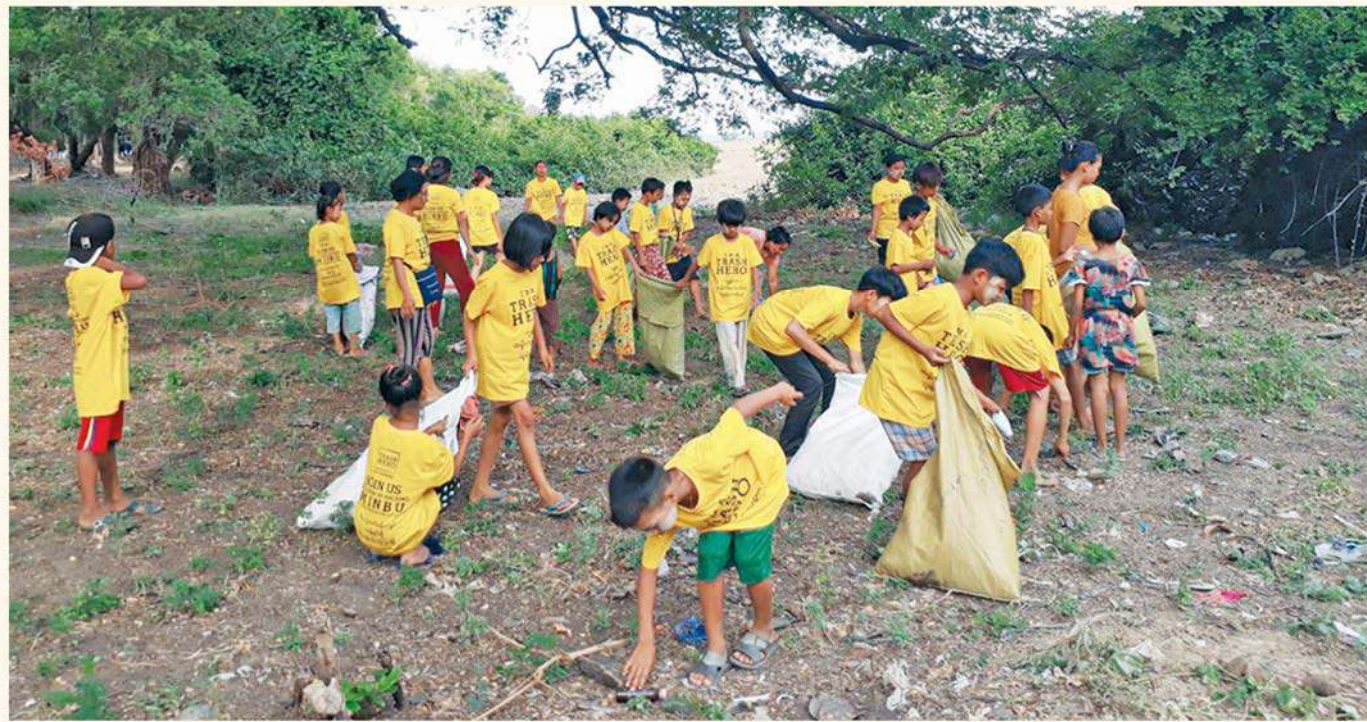
၂၀၁၈ ခုနှစ်မှစ၍ အမှိုက်ကောက်သူရဲကောင်း-မင်းဘူး (Trash Hero Minbu) သည် MPRL E&P (CSR အစီအစဉ်) နှင့်ပူးပေါင်း၍ မန်းရေနံမြေတွင် အမှိုက်ကောက်လှုပ်ရှားမှုများကို ဆောင်ရွက်ခဲ့ပြီး ၂၀၂၃-၂၀၂၄ ဘဏ္ဍာရေးနှစ်၊ ဒုတိယ