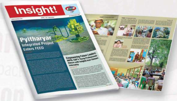
Insight! သတင်းလွှာ အမှတ် (၃၆) ထုတ်ဝေဖြန့်ချိခြင်း

MPRL E&P ၏ မန်းရေနံမြေတွင်ဆောင်ရွက်လျက်ရှိသည့် CSR လုပ်ငန်းများနှင့် စပ်လျဉ်း၍ လစဉ်၊ သုံးလတစ်ကြိမ်၊ ခြောက်လတစ်ကြိမ်နှင့် နှစ်ပတ်လည်အစီရင်ခံစာများဖြင့် သက်ဆိုင်ရာလုပ်ငန်းဆက်စပ်လုပ်ကိုင်သူများထံသို့ ပေးပို့အစီရင်ခံလျက်ရှိရာ ၂၀၂၃-၂၀၂၄ ဘဏ္ဍာရေးနှစ်၊ ဒုတိယသုံးလပတ်အတွင်း CSR လုပ်ငန်းဆောင်ရွက်ချက်ဆိုင်ရာ အစီရင်ခံစာကို ထုတ်ဝေခဲ့ပြီး မကွေးတိုင်းဒေသကြီး၊ အစိုးရအဖွဲ့နှင့် သက်ဆိုင်ရာလုပ်ငန်းဆက်စပ်လုပ်ကိုင်သူများထံ ပေးပို့ခဲ့သည်။ ■