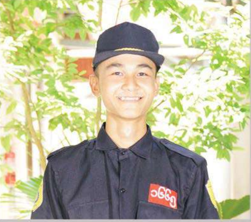
မောင်ထက်မြက်ရှိန် အောက်ကျောင်းကျေးရွာ အမှတ် (၅) စက်မှုသင်တန်းကျောင်း (မကွေး)

ပေးနေရတာကြောင့် ကျွန်တော့်ပညာသင်စရိတ်အတွက် အခက်အခဲရှိခဲ့ပါတယ်။ ဒါပေမယ့် ကျွန်တော်တို့လို ပညာ ဆက်သင်ဖို့ ငွေကြေးအခက်အခဲရှိတဲ့ မန်းရေနံမြေဒေသခံ လူငယ်တွေကို MPRL E&P ကုမ္ပဏီရဲ့ CSR အစီအစဉ်က နေ ပညာသင်စရိတ်ထောက်ပံ့ပေးနေတာ သိရပြီး ပညာသင် ဆုရအောင်ကြိုးစားခဲ့ပါတယ်။ အမှတ် (၅) စက်မှုသင်တန်း ကျောင်း (မကွေး) မှာ စက်မှုကျွမ်းကျင် တစ်နှစ်သင်တန်း တက်ဖို့ ဝင်ခွင့်ခေါ်တော့ ကျွန်တော်ဝင်ဖြေခဲ့ပါတယ်။ ဒီနှစ် ပညာသင်ဆုအတွက် ကျွန်တော်တို့လို လျှောက်ထားသူ တွေထဲက (၅) ဦးပဲ ရွေးချယ်မှာမို့ တော်တော်လည်း စိတ်လှုပ် ရှားခဲ့တယ်။ အခု MPRL E&P ၏ ပညာသင်ထောက်ပံ့ ကြေးနဲ့ အမှတ် (၅) စက်မှုသင်တန်းကျောင်း (မကွေး) မှာ Automobile Maintenance Course ကို တက်ခွင့်ရခဲ့ပါ ပြီ။ ကျောင်းမှာ ကားပြုပြင်ထိန်းသိမ်းတာ၊ မောင်းနှင်တာ နဲ့ ဂဟေဆော်တဲ့ ဘာသာရပ်တွေကို စာတွေ့၊ လက်တွေ့သင် ရပါတယ်။ ဒီပညာသင်ဆုအစီအစဉ်က ကျွန်တော်တို့ရဲ့ ပို ကောင်းတဲ့အနာဂတ်ဖြစ်ဖို့ အရေးကြီးတဲ့အထောက်အပံ့ တစ်ခုပါ။ ဒီလိုကူညီပံ့ပိုးမှုတွေအတွက် MPRL E&P ကုမ္ပဏီကို ကျေးဇူးတင်ပါတယ်။ ကျွန်တော် ကျောင်းပြီးလို့ အလုပ်အကိုင်တွေရခဲ့ရင်လည်း ရပ်ရွာဖွံ့ဖြိုးရေးကိစ္စတွေ မှာ တစ်တပ်တစ်အား ပါဝင်ကူညီသွားဖို့ ဆုံးဖြတ်ထား ပါတယ်။”