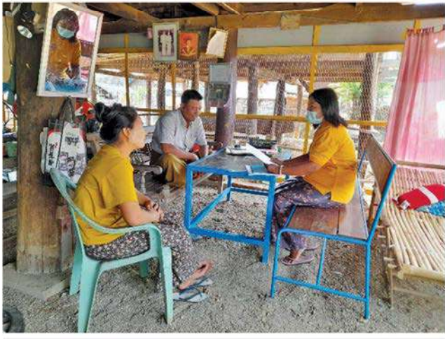
စေတနာ့ဝန်ထမ်းသစ်များကို လုပ်ငန်းဆိုင်ရာ ကြိုတင်ရှင်းလင်းဆွေးနွေးခြင်းနှင့် လိုအပ်သည်များ ပြင်ဆင်ပံ့ပိုးခြင်း