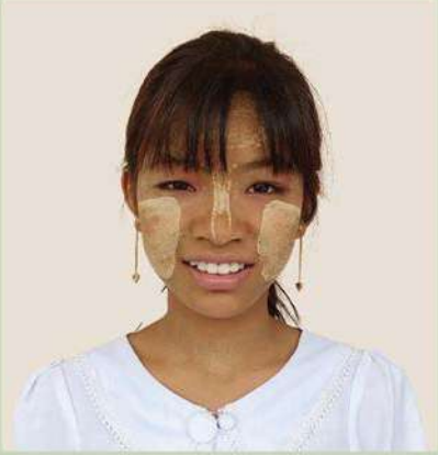
မကျူးကျူးဟန်

“သမီးက ကျေးရွာအဆင့်မှာ ပလတ်စတစ်ပစ္စည်းသုံးစွဲတာကို လုံးဝပျောက်အောင်မလုပ်ဆောင်နိုင်ပါ” ဆိုတဲ့ ဘက်ကနေ ဆွေးနွေးရတဲ့ အဖွဲ့ (၂) ကပါ။ ပြိုင်ပွဲသတ်မှတ်ချက်အရ မလုပ်နိုင်ပါဘူးဆိုတဲ့ ခေါင်းစဉ်အောက်ကနေ ရပ်တည်ယှဉ်ပြိုင်ခဲ့ရပေမယ့် ပလတ်စတစ်သုံးစွဲတာကို လျှော့နိုင်လိမ့်မယ်လို့တော့ ယုံကြည်ပါတယ်။ ပြိုင်ပွဲအတွက် စာအုပ်တွေနဲ့ အွန်လိုင်းကနေတစ်ဆင့် စာတွေရှာဖွေဖတ်ခဲ့ပြီး ဆရာ၊ ဆရာမတွေဆီကလည်း အကြံဉာဏ်တွေယူခဲ့ပါတယ်။ ပြိုင်ပွဲမှာတုန်းက စိတ်လှုပ်ရှားလွန်းလို့ တစ်ဖက်အသင်းကို ချေပပြောရမယ့်အချက်လေး နည်းနည်းမေ့သွားတာက သမီးအတွက် အမှတ်တရပါ။ ဒါပေမယ့် ဒီလိုပွဲမှာ ပါဝင်ယှဉ်ပြိုင်ခွင့်ရလို့ ဝမ်းသာဂုဏ်ယူမိပါတယ်။ ပလတ်စတစ်သုံးစွဲမှု လျှော့ချရေးကြိုပမ်းဆောင်ရွက်မှုတွေမှာ အခုလိုပဲ တက်တက်ကြွကြွ ပါဝင်သွားဖို့ ဆုံးဖြတ်ထားပါတယ်။”