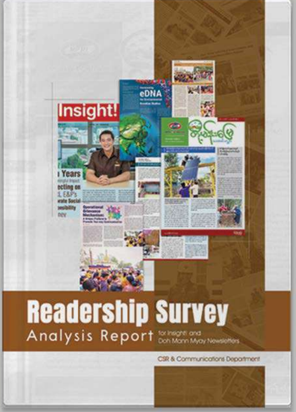
MPRL ELP ကုမ္ပဏီ၏ ထုတ်ဝေလျက်ရှိသည့် စာစောင်များအတွက် ဖတ်ရှုသူများ၏ သဘောထားမှတ်ချက် သုံးသပ်မှုအစီရင်ခံစာ

၂၀၂၃ ခုနှစ် ဇွန်လနှင့် ဇူလိုင်လကုန်အထိ စစ်တမ်းကောက်ယူချိန် သီတင်းပတ် (၆) ပတ်တာ အတွင်း Insight! စာစောင်အတွက် စစ်တမ်းဖြေဆိုသူ (၅၆) ဦးနှင့် တို့မန်းမြေ စာစောင်အတွက် စစ်တမ်း ဖြေဆိုသူ (၇၇) ဦးတို့ထံမှ သဘောထားမှတ်ချက်များ ကောက်ယူရရှိခဲ့သည်။ အဆိုပါ စစ်တမ်းအရ လေ့လာတွေ့ရှိချက်များကို CSR & Communications ဌာနအနေဖြင့် ဌာနတွင်း အစီရင်ခံစာတစ်စောင် ရေးသားတင်ပြခဲ့ပြီး စစ်တမ်းပါအကြံပြုချက်များအနက် လိုက်နာဆောင်ရွက်နိုင်မည့် အစီအစဉ်များကို အစီရင်ခံစာတွင် ရေးသားဖော်ပြထားသည်။ ■