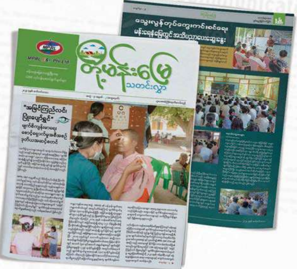
တို့မန်းမြေ သတင်းလွှာ အမှတ် (၁၀) ထုတ်ဝေဖြန့်ချိခြင်း

ထို့အပြင် ကုမ္ပဏီ ၏ CSR လုပ်ငန်းဆောင်ရွက်ချက်များကို ဒေသခံများအနေဖြင့် စဉ်ဆက်မပြတ် သိရှိနားလည်နိုင်စေရန်နှင့် ပူးပေါင်းပါဝင်ဆောင်ရွက်မှုပိုမိုရရှိစေရန် စာစောင်များကို လွယ်လင့်တကူဖတ်ရှုနိုင်ရေးအတွက်လည်း ကျေးရွာစာကြည့်တိုက်များနှင့် ကျေးရွာအတွင်းစုရပ်များတွင် တို့မန်းမြေစာတိုက်ပုံးများ တပ်ဆင်ထားရှိပြီး သတ်မှတ်လ