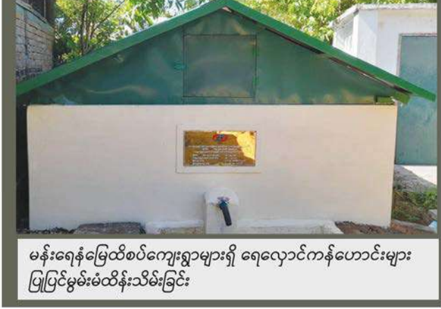
မန်းရေန်မြေထိစပ်ကျေးရွာများရှိ ရေလှောင်ကန်ဟောင်းများ ပြုပြင်မွမ်းမံထိန်းသိမ်းခြင်း