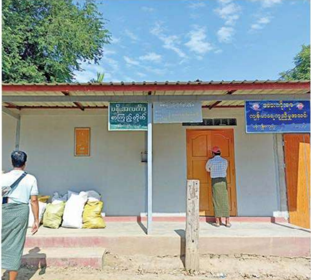
မန်းကျိုးကျေးရွာစာကြည့်တိုက်အဆင့်မြှင့်တင်ခြင်းလုပ်ငန်းများအတွက် ကျေးရွာအုပ်ချုပ်ရေးမှူးနှင့်တွေ့ဆုံဆွေးနွေးခြင်း