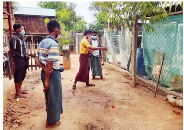
ပေါက်ကုန်းကျေးရွာတွင် အများသုံးရေတွင်းတူးဖော်နိုင်ရေး မြေနေရာ ကြည့်ရှုစစ်ဆေးခြင်း

ရေတွင်းတူးဖော်ရေးလုပ်ငန်းများကို ကျွဲချကျေးရွာတွင် ၂၀၂၂ ခုနှစ်၊ မေလ အတွင်းစတင်ခဲ့ပြီး ရေတွင်းအမိုးတည်ဆောက်ခြင်းနှင့် ရေစုပ်စက်နှင့် ဆက်စပ်ပစ္စည်းများ ပံ့ပိုးခြင်းတို့ကို ဆောင်ရွက်ခဲ့ရာ MPRL E&P (CSR အစီအစဉ်) ဖြင့် ကျပ် ၁,၁၀၀,၀၀၀/ (ကျပ် တစ်ဆယ့်တစ်သိန်း) နှင့် ကျေးရွာနေဒေသခံများက ကျပ် ၄၀၀,၀၀၀/ (ကျပ်လေးသိန်း) ပူးပေါင်းပါဝင်ပံ့ပိုးခဲ့သည်။ အဆိုပါလုပ်ငန်းများကို ၂၀၂၂ခုနှစ်၊ ဇွန်လ (၁၀) ရက်နေ့တွင် အပြီးသတ်ဆောင်ရွက်ခဲ့ပြီး သက်ဆိုင်ရာကျေးရွာအုပ်ချုပ်ရေးမှူးနှင့် ကျေးရွာဖွံ့ဖြိုးရေးကော်မတီများထံ စနစ်တကျ လွှဲပြောင်းပေးအပ်ပြီးဖြစ်သည်။ ထို့ပြင် ပေါက်ကုန်းကျေးရွာတွင် ရေတွင်းတူးဖော်နိုင်ရေးအတွက် CSR လုပ်ငန်းအဖွဲ့ဝင်များက သက်ဆိုင်ရာအဖွဲ့အစည်းများနှင့် ပူးပေါင်းဆောင်ရွက်လျက်ရှိသည်။