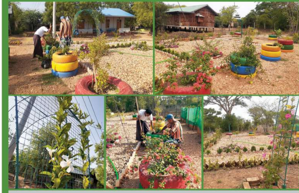
လက်ပံတပင်ကျေးရွာ အခြေခံပညာကျောင်းရှိ “စိမ်းလန်းစိုပြေ တို့ကျောင်းမြေ” အစီအစဉ် တိုးတက်မှုအခြေအနေ