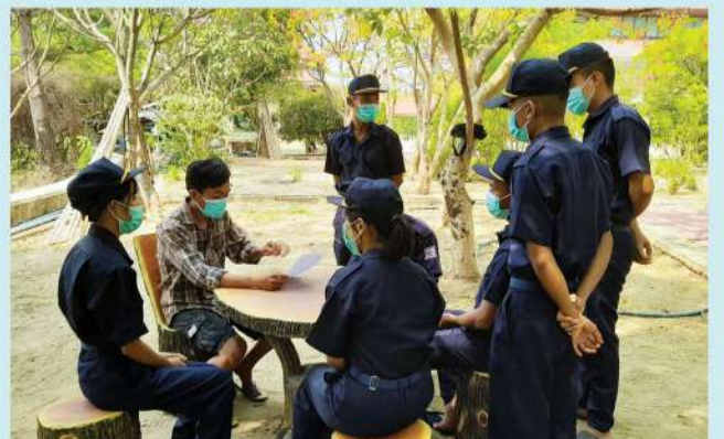
အမှတ် (၅) စက်မှုသင်တန်းကျောင်း (မကွေး) တွင် သင်တန်းတက်ရောက်လျက်ရှိသည့် မန်းရေနံမြေဒေသခံလူငယ် (၇) ဦးနှင့် ပုံမှန်သွားရောက်တွေ့ဆုံပြီး လိုအပ်သည်များပံ့ပိုးခြင်း

စက်မှုဝန်ကြီးဌာန၊ စက်မှုပူးပေါင်းဆောင်ရွက်ရေး ဦးစီးဌာန၊ သင်တန်းကျောင်းများကြီးကြပ်ရေးဌာန၏ အမှတ် (၅) စက်မှုသင်တန်းကျောင်း (မကွေး) တွင် “စက်မှုကျွမ်းကျင် (၁) နှစ် သင်တန်း” အမှတ်စဉ် (၁၀) သို့ MPRL E&P (CSR အစီအစဉ်) ပါ ပညာရေးဆိုင်ရာ ပူးပေါင်းဆောင်ရွက်မှု အစီအစဉ်၏ ပညာသင်ဆုဖြင့် မန်းရေနံမြေဒေသခံ (၇) ဦး တက်ရောက်လျက်ရှိရာ CSR လုပ်ငန်းအဖွဲ့ဝင်များက ၂၀၂၂ ခုနှစ်၊ မေလအတွင်း အဆိုပါသင်တန်းကျောင်း၊ တာဝန်ရှိသူထံ သွားရောက်တွေ့ဆုံကာ သင်တန်းတက်ရောက် လေ့လာမှုအခြေအနေနှင့် သင်တန်းဆိုင်ရာ ပံ့ပိုးမှုများကို ပံ့ပိုးဆောင်ရွက်နိုင်ရေး ဆွေးနွေးခဲ့သည်။ ■