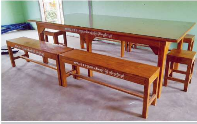
အေးမြကျေးရွာ လူထုအခြေပြုဗဟိုဌာန ကနဦးစီမံချက်အတွက် MPRL E&P (CSR အစီအစဉ်) ဖြင့် ဆောင်ရွက်ပြီးစီးမှုအခြေအနေ