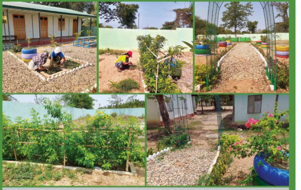
မယ်ဘေ့ကုန်းကျေးရွာ အခြေခံပညာကျောင်းရှိ “စိမ်းလန်းစိုပြေ တို့ကျောင်းမြေ” အစီအစဉ် တိုးတက်မှုအခြေအနေ