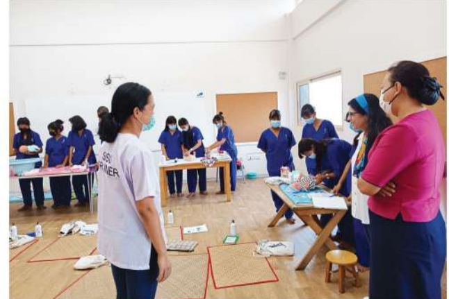
Step-in Step-up (SISU) သို့ MPRL E&P CSR လုပ်ငန်းအဖွဲ့ဝင်များ သွားရောက်လေ့လာခြင်း

၂၀၂၂ခုနှစ်၊ မေလအတွင်း လူငယ်သက်မွေးပညာပံ့ပိုးမှုကိုယ်ရည်ကိုယ်သွေးနှင့် လူမှုရေးဆိုင်ရာ ဖွံ့ဖြိုးမှုအတွက် လူငယ်များကိုပံ့ပိုးလျက်ရှိသော အစိုးရမဟုတ်သောအဖွဲ့အစည်းဖြစ်သည့် Step-in Step-up (SISU) နှင့် MPRL E&P CSR လုပ်ငန်းအဖွဲ့ဝင်များက SISU တည်ရှိရာ ရန်ကုန်မြို့၊ ပန်းလှိုင်အိမ်ရာသို့ သွားရောက်တွေ့ဆုံပြီး ယင်းအဖွဲ့အစည်း၏ လူငယ်ဖွံ့ဖြိုးရေးလုပ်ငန်းလုပ်ဆောင်မှု အခြေအနေများကိုလေ့လာခြင်း၊ မန်းရေနံမြေတွင် လူငယ်သက်မွေးပညာသင်တန်းများပေးလျက်ရှိသည့် အခြေအနေတို့ကို