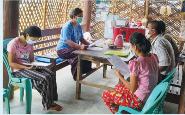
သင်တန်းတက်ရောက်မည့် ကျောင်းသား၊ မိဘများနှင့် အကြံပြုတွေ့ဆုံဆွေးနွေးခြင်း

MPRL E&P (CSR အစီအစဉ်) ဖြင့် ပံ့ပိုးမည့် ပညာသင်ဆုရ ကျောင်းသားများအနေဖြင့် စိုက်ပျိုးရေးသိပ္ပံ (ပွင့်ဖြူ) တွင် တက်ရောက်ပညာသင်ကြားမည့် ကျောင်းသားများ ကျောင်းတက်စဉ် ကာလတစ်လျှောက်လုံးတွင် သတ်မှတ်စည်းကမ်းများကို သိရှိသဘောတူ လိုက်နာဆောင်ရွက်နိုင်ရန်နှင့် ဘာသာရပ်အလိုက် သင်တန်းပြီးဆုံးသည်အထိ အောင်မြင်အောင် ကြိုးပမ်းလေ့လာနိုင်ရန် ကျောင်းသားမိဘများနှင့် ကျောင်းသားများကို CSR လုပ်ငန်းအဖွဲ့ဝင်များက CSR အစီအစဉ်ဖြင့် ပံ့ပိုးမည့်အစီအစဉ်များနှင့် ကျောင်းသားများလိုက်နာရန် စည်းကမ်းသတ်မှတ်ချက်များကို သိရှိသဘောတူ လက်မှတ်ရေးထိုးစေပြီး ကျောင်းအပ်နှံရေးလုပ်ငန်းများကို ဆောင်ရွက်ခဲ့သည်။