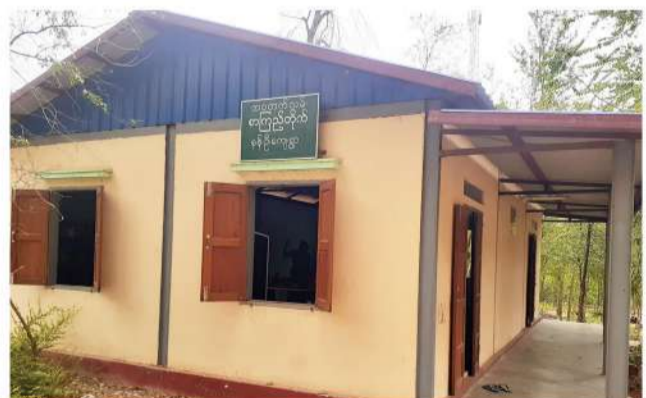
မန်းကျီးနှင့်နန်းဦးကျေးရွာတို့တွင် ကျေးရွာလူထုအခြေပြု ဗဟိုဌာန ကနဦးစီမံချက်အတွက် ဆွေးနွေးတိုင်ပင်ခြင်း

မန်းရေနံမြေတွင် လုပ်ငန်းလုပ်ကိုင်ဆောင်ရွက်လျက်ရှိ သည့် MPRL E&P ကုမ္ပဏီ အနေဖြင့် လူမှုတာဝန်သိ CSR လုပ်ငန်းများကို မန်းရေနံမြေဒေသခံပြည်သူများ၏ လိုအပ်ချက်နှင့်လိုလားချက်များကို ဆန်းစစ်ပြီးမှသာ ပိုမို ပြည့်စုံသည့် လူမှုအသိုက်အဝန်းဖြစ်စေရန် သက်ဆိုင်ရာ ဘဏ္ဍာရေးနှစ်အလိုက် ဦးစားပေးအစီအစဉ်များ သတ်မှတ် ပံ့ပိုးလျက်ရှိပါသည်။ ၂၀၂၂-၂၀၂၃ ဘဏ္ဍာရေးနှစ်အတွင်း မန်းရေနံမြေထိစပ်ကျေးရွာများရှိ ကျေးရွာစာကြည့်တိုက် များကို လူထုအခြေပြုဗဟိုဌာနအဖြစ် အဆင့်မြှင့်တင်သည့် ကနဦးအစီအစဉ်အဖြစ် ဆောင်ရွက်နိုင်ရန် ကျေးရွာ (၁၄) ရွာရှိ စာကြည့်တိုက်များ၏ လက်ရှိအခြေအနေနှင့် ဆောင် ရွက်နိုင်မည့်လုပ်ငန်းများကို ဆန်းစစ်ပြီး အေးမြကျေးရွာ စာကြည့်တိုက်ကို ကျေးရွာလူထုအခြေပြုဗဟိုဌာနအဖြစ် အဆင့်မြှင့်တင်ရန် ကနဦးစီမံချက်အဖြစ် လုပ်ငန်းစတင်ခဲ့ သည်။ လူထုအခြေပြုဗဟိုဌာနအဆင့်သို့ တိုးမြှင့်သည့် လုပ်ငန်းများ မဆောင်ရွက်မီ နေရာဒေသအလိုက် တည် ဆောက်ထားရှိသည့် Community Center တစ်ခုတွင်