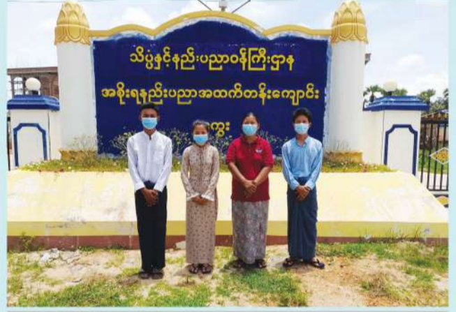
အစိုးရနည်းပညာအထက်တန်းကျောင်း (မကွေး) သို့ တက်ရောက်ခွင့်ရရှိသည့် ကျောင်းသားများနှင့် သွားရောက်တွေ့ဆုံဆွေးနွေးခြင်း

ဆေးဝါးကျွမ်းကျင်နှင့် ကျန်းမာရေးစောင့်ရှောက်မှု သင်တန်းသားများ သင်တန်းပြီးဆုံးအောင်မြင်၍ အလုပ်အကိုင်သစ်များသို့ စတင်ဝင်ရောက်လုပ်ကိုင်