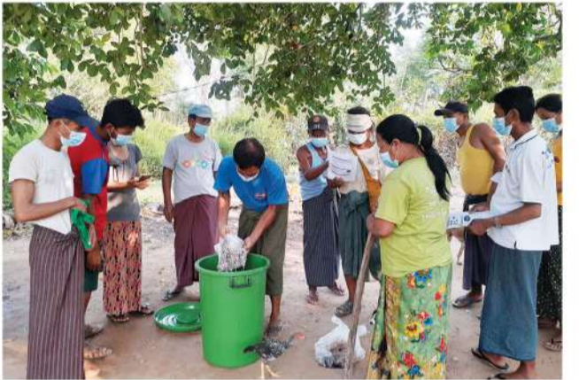
မယ်ဘောကုန်းနှင့် အောက်ကျောင်းကျေးရွာတို့တွင် ငါးအမိုင်နို အက်ဆစ်ရွက်ဖြန်းအားဆေး ထုတ်လုပ်နည်းသင်တန်းပို့ချခြင်း

သည့် နိုက်ထရိုဂျင်၊ ဖော့စဖရက်နှင့် ပိုတက်စီယမ်ကဲ့သို့ ကြီးထွားမှုကိုလှုံ့ဆော်သည့် ဓာတ်များပါဝင်ပြီး ပြုလုပ် သည့် ငါးအမျိုးအစားအလိုက် အာဟာရဓာတ်ပါဝင်မှုများ ကွာခြားနိုင်သည်။ အပင်များကို အမိုင်နိုအက်ဆစ်များ ပက်ဖြန်းပေးခြင်းဖြင့် အပင်ကြီးထွားလာချိန်တွင် ထွက်ရှိ သည့်ဟော်မုန်းများကို တိုးပွားလာစေပြီး အရွက်မျက်နှာ ပြင်မှ စုပ်ယူနိုင်သဖြင့် ရွက်ဖြန်းအားဆေးအဖြစ်လည်း ကောင်း၊ မြေဆီဩဇာတိုးတက်စေ၍ အဏုဇီဝများ ပွားများ လာစေရန်အတွက် မြေဆီလွှာအတွင်း ထည့်သွင်းပေးခြင်း ဖြင့်လည်းကောင်း အသုံးပြုကြသည်။