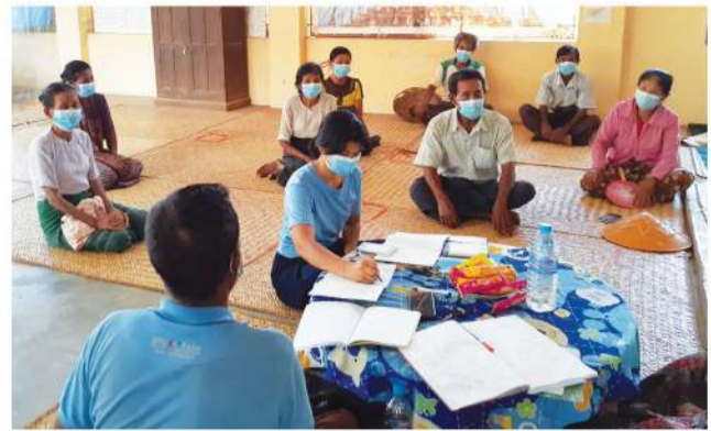
မျိုးစေ့ဘဏ်အစီအစဉ်အရ ကြာကန်ကျေးရွာ စိုက်ပျိုးတောင်သူများထံမှ မျိုးစေ့များပြန်လည်သိမ်းယူစုဆောင်းခြင်း

၂၀၂၂ ခုနှစ် ဧပြီလတွင် ကြာကန်ကျေးရွာစိုက်ပျိုးတောင်သူများထံမှ ပြီးခဲ့သည့် စိုက်ပျိုးရာသီတွင် ဖြန့်ဝေခဲ့သော မျိုးစေ့များပြန်လည်စုဆောင်းသိမ်းယူခြင်းကို ဆောင်ရွက်နိုင်ခဲ့သည်။