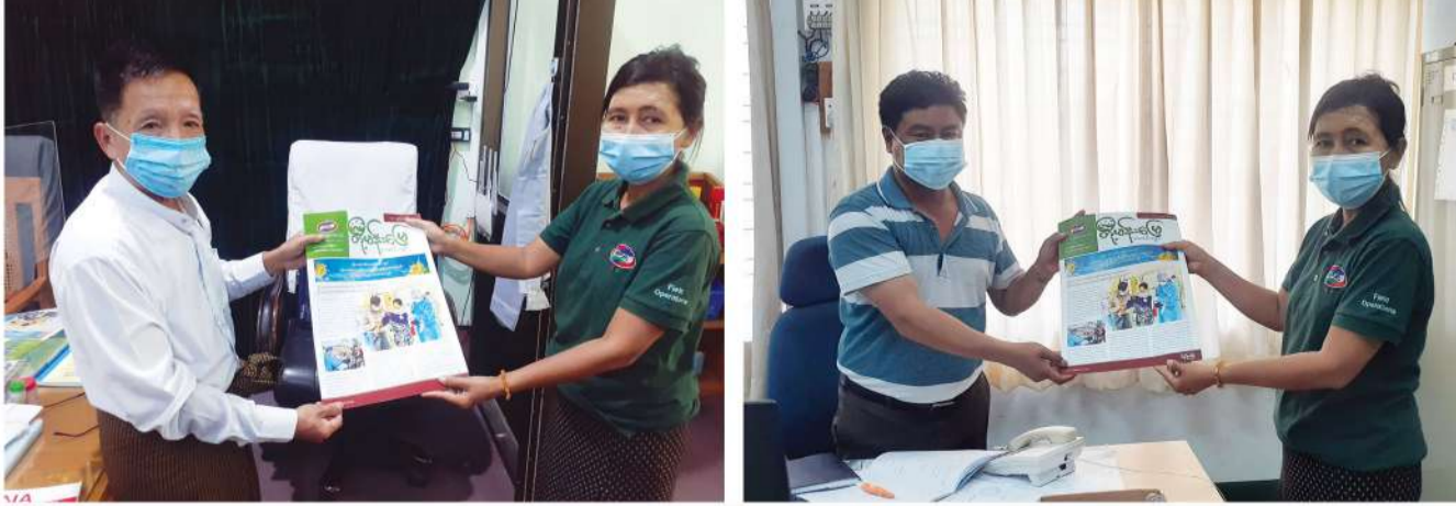
တို့မန်းမြေ သတင်းလွှာ အမှတ် (၄) ကို သက်ဆိုင်ရာအဖွဲ့အစည်းများသို့ ဖြန့်ချိခြင်း