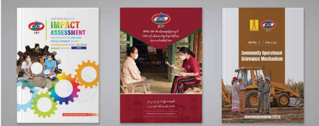
၂၀၂၂-၂၀၂၃ ဘဏ္ဍာရေးနှစ်၊ ပထမသုံးလပတ်အတွင်း ရေးသားထုတ်ဝေခဲ့သည့် အစီရင်ခံစာများ

လက်ရှိအချိန်တွင် Insight! သတင်းလွှာနှင့် တို့မန်းမြေ စာစောင်များကို ဒေသခံလူထုနှင့် ကုမ္ပဏီဝန်ထမ်းများ ဖတ်ရှုနိုင်ရုံသာမက ပြည်တွင်း၊ ပြည်ပရှိ မိတ်ဖက်အဖွဲ့