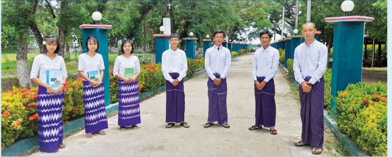
စိုက်ပျိုးရေးသိပ္ပံ (ပွင့်ဖြူ) ၏ စိုက်ပျိုးရေး ဒီပလိုမာ (၃) နှစ်သင်တန်းသို့ တက်ရောက်မည့် မန်းရေနံမြေဒေသခံ ပညာသင်ဆုကျောင်းသားများ

၂၀၂၂-၂၀၂၃ ပညာသင်နှစ်အတွက် စိုက်ပျိုးရေးသိပ္ပံ (ပွင့်ဖြူ) တွင် မန်းရေနံမြေဒေသခံကျောင်းသားများ တက်ရောက်သင်ကြားနိုင်ရန် အဆိုပါကျောင်း၏ ကျောင်းအုပ်ကြီးနှင့် CSR လုပ်ငန်းအဖွဲ့ဝင်များက သွားရောက်တွေ့ဆုံဆွေးနွေးခဲ့သည်။ အလားတူ မန်းရေနံမြေ ထိစပ်ကျေးရွာများမှ ရွေးချယ်ခံကျောင်းသား၊ ကျောင်းသူများနှင့် တွေ့ဆုံပြီး ကျောင်းစတင်တက်ရောက်နိုင်ရန် ကြိုတင်ပြင်ဆင်မှုများ ဆောင်ရွက်ခဲ့သည်။