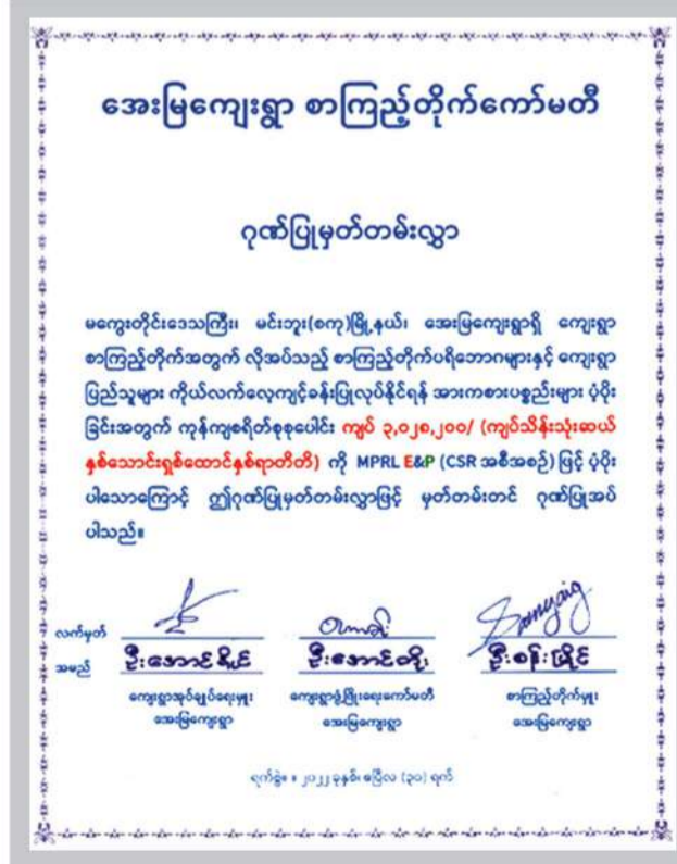
အေးမြကျေးရွာ လူထုအခြေပြုဗဟိုဌာန ကနဦးစီမံချက်အတွက် MPRL E&P (CSR အစီအစဉ်) ဖြင့် ဆောင်ရွက်ပြီးစီးမှုအခြေအနေ

သို့ဖြစ်၍ မင်းဘူးခရိုင်၊ မန်းရေနံမြေထိစပ်ကျေးရွာများ တွင် ဒေသခံများ၏ပညာရေး၊ ကျန်းမာရေး၊ အသိပညာ ဖွံ့ဖြိုးရေးနှင့် ကျေးရွာဖွံ့ဖြိုးတိုးတက်ရေးဆိုင်ရာလုပ်ငန်း များကို ကျေးရွာလူထုအခြေပြုဗဟိုဌာနများမှတစ်ဆင့် ကျယ်ကျယ်ပြန့်ပြန့်ဆောင်ရွက်ပြီး ပိုမိုပြည့်စုံသည့်လူမှု အသိုက်အဝန်းဆီသို့ ရောက်ရှိနိုင်မည့် ကနဦးခြေလှမ်း အဖြစ် MPRL E&P (CSR အစီအစဉ်) ဖြင့် ဆောင်ရွက် လျက်ရှိကြောင်း တင်ပြလိုက်ပါသည်။ ■