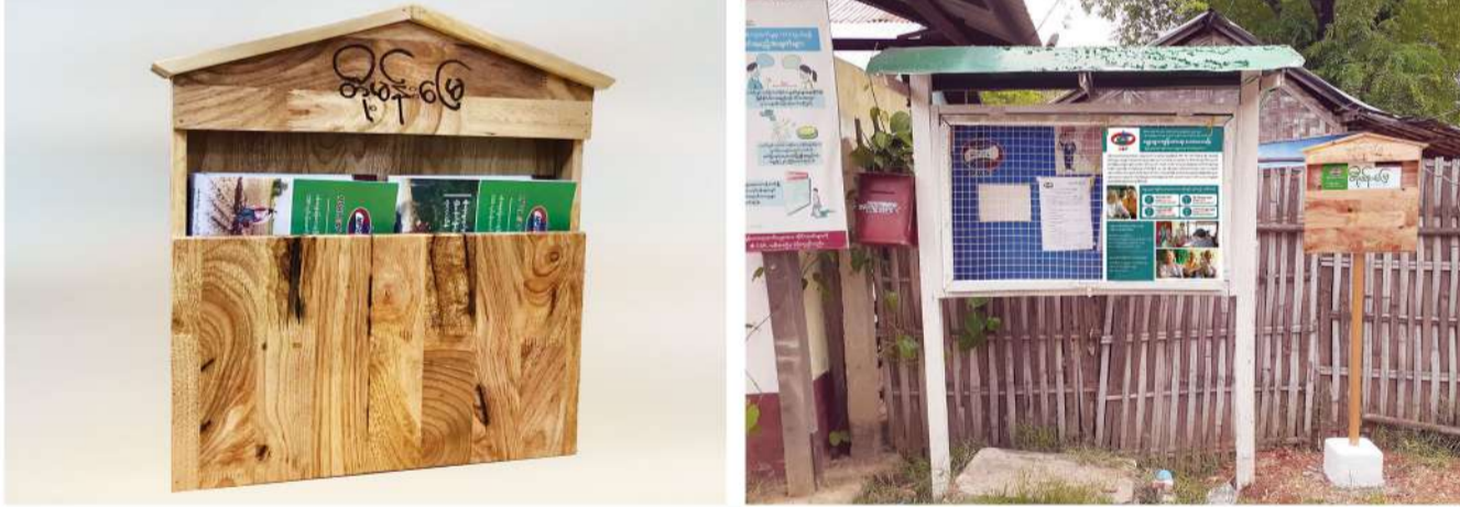
တို့မန်းမြေစာစောင်ကို ဒေသခံများဖတ်ရှုနိုင်ရန် မန်းရေနံမြေကျေးရွာများတွင် ထားရှိသည့်ပုံစံ