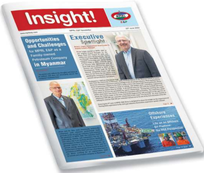
Insight! သတင်းလွှာ အမှတ် (၃၁) ထုတ်ဝေဖြန့်ချိခြင်း

၂၀၂၂ ခုနှစ်၊ ဇွန်လထုတ် Insight! သတင်းလွှာ အမှတ် (၃၁) တွင် နိုင်ငံခြားသား ရေနံပညာရှင်များ၏ ဆောင်းပါးများ၊ မြန်မာအင်ဂျင်နီယာများ၏ ကမ်းလှန်ရန်စင်များတွင် သွားရောက်လုပ်ကိုင်ခဲ့သည့် အတွေ့အကြုံများ၊ မန်းရေနံမြေ CSR လုပ်ငန်းဆောင်ရွက်ချက်များနှင့်စပ်လျဉ်း၍ ဒေသခံများ၏ သိရှိနားလည်မှုသဘောထားဆန်းစစ်ခြင်း၊ ရေနံမြေဝန်ထမ်းများအတွက် အခါအားလျော်စွာ ပြုလုပ်ပံ့ပိုးခဲ့သည့် ကျန်းမာရေး၊ ဘေးကင်းလုံခြုံရေးနှင့်ပတ်ဝန်းကျင်ထိန်းသိမ်းရေးဆိုင်ရာ သင်တန်းများ၊ ဝန်ထမ်းတစ်ဦးချင်း၏ အတွေးအခေါ်၊ ခံယူချက်နှင့်အတွေ့အကြုံများ၊ Myint & Associates Telecommunications Ltd. ၏ နည်းပညာနယ်ပယ်မှအမျိုးသမီးတစ်ဦး၊ ၂၀၂၂ ခုနှစ် နှစ်ဆန်းပိုင်းတွင် ထုတ်ဝေခဲ့သည့် အမှုဆောင်အရာရှိချုပ်၏ အတ္ထုပ္ပတ္တိအပေါ် ဝန်ထမ်းအချို့၏ မှတ်ချက်စကားများ စသည်ဖြင့် ကဏ္ဍပေါင်းစုံပါဝင်အောင် စုစည်းတင်ဆက်ထားသည်။