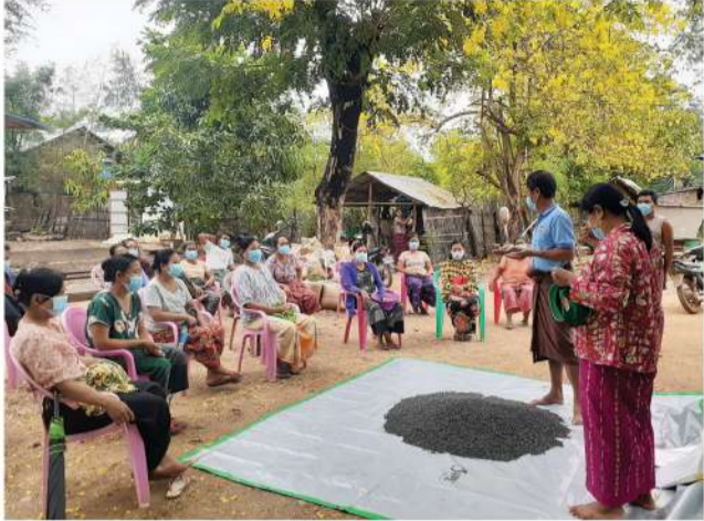
ဈေးကွက်ဝင် မျိုးစေ့ထုတ်ပေးအဖြစ် စနစ်တကျ ထုတ်ပိုးရောင်းချ နိုင်ရန် လက်တွေ့သရုပ်ပြသခြင်း

၂၀၂၁-၂၀၂၂ ဘဏ္ဍာရေးနှစ်မှစတင်၍ MPRL E&P (CSR အစီအစဉ်) ဖြင့် မန်းရေနံမြေတွင် တောင်သူသင်တန်း ကျောင်း (Farmer Field School-FFS) အစီအစဉ်ကို စတင် ခဲ့ပြီး စိုက်ပျိုးရေး အလေ့အကျင့်ကောင်းများမျှဝေခြင်း၊ သီးနှံအလိုက် မျိုးကောင်းမျိုးသန့် မျိုးစေ့ထုတ်လုပ်ခြင်း၊ ဖြန့်ဖြူးမှု၊ သို့လျှောက်ရောင်းချခြင်း၊ သဘာဝအပင်အားဆေး နှင့်ပိုးသတ်ဆေးများ ကိုယ်တိုင်ကိုယ်ကျထုတ်လုပ် သုံးစွဲ နိုင်ရေးအတွက် တောင်သူပညာပေးအစီအစဉ်များပံ့ပိုးခြင်း စသည့် တောင်သူသိမှတ်ဖွယ်ရာများကို တောင်သူပညာ ပေးဆွေးနွေးပွဲများ၊ သင်တန်းများနှင့် သီးနှံရိတ်သိမ်းပြီး ချိန်တွင် ပြုလုပ်သည့် ပြန်လည်သုံးသပ်သည့် အလုပ်ရုံဆွေး နွေးပွဲများဖြင့် ပံ့ပိုးလျက်ရှိသည်။ ထို့ပြင် မင်းဘူးမြို့နယ် စိုက်ပျိုးရေးဦးစီးဌာနမှ စိုက်ပျိုးရေးဆိုင်ရာကျွမ်းကျင်သူ များ၏ အကူအညီဖြင့် စိုက်ပျိုးရေးနည်းပညာဘာသာရပ် အလိုက် သင်တန်းပို့ချခြင်း၊ လက်တွေ့သရုပ်ပြလေ့ကျင့် ခြင်း၊ မျိုးစေ့စိုက်ပျိုး ထုတ်လုပ်မှုများကို အနီးကပ်ကွင်း ဆင်းလေ့လာပြီး လိုအပ်သည့်အကြံဉာဏ်များ၊ လမ်းညွှန် မှုများပေးခြင်းနှင့် တောင်သူအချင်းချင်း အသိပညာမျှဝေ နိုင်ရန် CSR လုပ်ငန်းအဖွဲ့ဝင်များက သက်ဆိုင်ရာအဖွဲ့ အစည်းများနှင့် ချိတ်ဆက်ဆောင်ရွက်လျက်ရှိသည်။