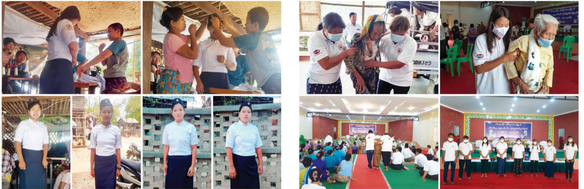
အရေးပေါ်ကိစ္စရပ်များတုံ့ပြန်ဆောင်ရွက်မှုအဖွဲ့ (Emergency Response Team) အဖွဲ့ ဝင်များအတွက် ဝတ်စုံများကို နမ္မဒါ အမျိုးသမီး အပ်ချုပ်လုပ်ငန်းအဖွဲ့ဝင်များက ချုပ်လုပ်ပြီး MPRL E&P (CSR အစီအစဉ်) ဖြင့်ပံ့ပိုးခြင်း

၂၀၂၂ ခုနှစ်၊ ဧပြီလတွင် မင်းဘူးခရိုင်၊ မင်းဘူး (စကျ) မြို့နယ်၊ နှစ်သစ်ကူးအန္တရာယ်ကင်းပရိတ်ရွတ်ဖတ် ပူဇော် ပွဲနှင့်သက်ကြီး ဘိုး၊ ဘွား ပူဇော်ပွဲအခမ်းအနားတွင် ကန်တော့ခံမြို့မိမြို့ဖ၊ သက်ကြီးဝါကြီးများအတွက် လိုအပ်သည့်အကူအညီများပံ့ပိုးနိုင်ရန် သက်ဆိုင်ရာအဖွဲ့ အစည်းများက အကူအညီတောင်းခံခဲ့သည့်အတွက် အဆိုပါအခမ်းအနားတွင် မန်းရေနံမြေဒေသခံ Emer- gency Response Team အဖွဲ့ဝင်များက စေတနာ့ ဝန်ထမ်း ပါဝင်ဆောင်ရွက်လုပ်အားပေးနိုင်ခဲ့သည်။ အဖွဲ့ ဝင်များအနေဖြင့် မန်းရေနံမြေနှင့် မင်းဘူးမြို့နယ်အတွင်း ရှိ သာရေး၊ နာရေးနှင့် အခြားအရေးပေါ်ကိစ္စရပ်များတွင် ပါ စေတနာ့ဝန်ထမ်း ပါဝင်ဆောင်ရွက်နိုင်ရေးအတွက် CSR လုပ်ငန်းအဖွဲ့ဝင်များက လေ့လာဆန်းစစ်ကာ စဉ်ဆက် မပြတ်ပံ့ပိုးနိုင်ရေး ဆောင်ရွက်လျက်ရှိသည်။ ■