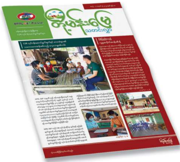
တို့မန်းမြေ သတင်းလွှာ အမှတ် (၅) ထုတ်ဝေဖြန့်ချိခြင်း

၂၀၂၂-၂၀၂၃ ဘဏ္ဍာရေးနှစ်၊ ပထမသုံးလပတ်အတွင်း မန်းရေနံမြေတွင် ဆောင်ရွက်လျက်ရှိသည့် CSR လုပ်ငန်းဆောင်ရွက်ချက်များနှင့် ပြန်ကြားဆက်သွယ်ခြင်းလုပ်ငန်းများကို သက်ဆိုင်ရာ ဒေသခံအဖွဲ့များ နားလည်သဘောပေါက် သိရှိမှုအခြေအနေနှင့် သဘောထားမှတ်ချက်များကို ဆန်းစစ်သည့် စစ်တမ်းအစီရင်ခံစာ (Impact Assessment Report) ကို ထုတ်ဝေနိုင်ခဲ့သည်။ ထို့အပြင် MPRL E&P ၏ မန်းရေနံမြေ CSR လုပ်ငန်းဆောင်ရွက်ချက်ဆိုင်ရာ သုံးလပတ်အစီရင်ခံစာ၊ အကြံပြုဆွေးနွေးခြင်းလုပ်ငန်းစဉ်ဆိုင်ရာ သုံးလပတ်အစီရင်ခံစာတို့ကိုလည်း အချိန်နှင့်တပြေးညီ ရေးသားထုတ်ဝေခဲ့ပြီး ကုမ္ပဏီ၏ ဝက်ဘ်ဆိုဒ်စာမျက်နှာနှင့် သက်ဆိုင်ရာလုပ်ငန်းဆက်စပ်လုပ်ကိုင်သူများထံ ပေးပို့အစီရင်ခံတင်ပြခဲ့သည်။ ■