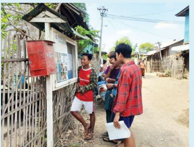
အစိုးရနည်းပညာအထက်တန်းကျောင်းတက်ရောက်နိုင်ရန် မန်းရေနံမြေ ဒေသခံလူငယ်များ ပညာသင်ဆုလျှောက်ထားနိုင်ကြောင်း ဖိတ်ခေါ်ခြင်း