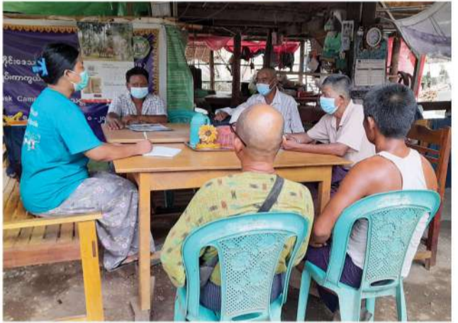
ရွာသာကျေးရွာ မြစ်ရေတင်စီမံကိန်းအတွက် ဒီဇယ်အင်ဂျင်၊ ရေစုပ်စက်နှင့် ရေပိုက်လိုင်းများ အသစ်တပ်ဆင်နိုင်ရေး ဆွေးနွေးခြင်း

MPRL E&P (CSR အစီအစဉ်) ဖြင့် ၂၀၁၅ ခုနှစ်တွင် ပံ့ပိုးခဲ့သည့် ရွာသာကျေးရွာ မြစ်ရေတင်စီမံကိန်းတွင် အသုံးပြုလျက်ရှိသည့် ဒီဇယ်အင်ဂျင်နှင့်ရေစုပ်စက်များသည် ပုံမှန်ပြုပြင်ထိန်းသိမ်းမှု အကြိမ်ကြိမ် ပြုလုပ်ခဲ့ပြီး အသစ်လဲလှယ်ရန် လိုအပ်ချက်ရှိသည်ကို ဆန်းစစ်တွေ့ရှိသဖြင့် ၂၀၂၂-၂၀၂၃ ဘဏ္ဍာရေးနှစ်အတွင်း ဒေသဖွံ့ဖြိုးရေး လုပ်ငန်းဆောင်ရွက်မှုတစ်ခုအဖြစ် ပံ့ပိုးနိုင်ရန်စီစဉ်ထားရှိရာ