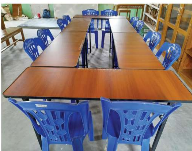
အေးမြကျေးရွာ လူထုအခြေပြုဗဟိုဌာန ကနဦးစီမံချက်အတွက် MPRL E&P (CSR အစီအစဉ်) ဖြင့် ဆောင်ရွက်ပြီးစီးမှုအခြေအနေ

ထို့ပြင် လက်ရှိလည်ပတ်ဆောင်ရွက်လျက်ရှိသော ကျေးရွာ စာကြည့်တိုက်မှူးများနှင့် အရံစာကြည့်တိုက်မှူးများကို စာကြည့်တိုက်စီမံခန့်ခွဲရေးလုပ်ငန်းများဖြစ်သည့် စာအုပ်