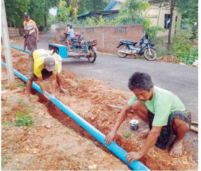
ရွာသာကျေးရွာ မြစ်ရေတင်စီမံကိန်းအတွက် ဒီဇယ်အင်ဂျင်၊ ရေစုပ်စက်နှင့် ရေပိုက်လိုင်းများ အသစ်တပ်ဆင်ခြင်း

၂၀၂၂ ခုနှစ်၊ မေလအတွင်း CSR လုပ်ငန်းအဖွဲ့ဝင်များက လုပ်ငန်းစတင်ဆောင်ရွက်နိုင်ရန် ကျေးရွာအုပ်ချုပ်ရေးမှူးနှင့် ကျေးရွာဖွံ့ဖြိုးတိုးတက်ရေး ကော်မတီများ၊ ဒေသခံစေတနာ့ဝန်ထမ်းများနှင့် တွေ့ဆုံဆွေးနွေးမှုများ ပြုလုပ်ခဲ့သည်။ အလားတူ မီးစက်နှင့်ရေစုပ်စက်များ အသစ်ဝယ်ယူဖြည့်ဆည်းနိုင်ရေး၊ သွယ်တန်းထားသည့် ရေပိုက်လိုင်းများတွင် ပြန်လည်ပြုပြင်တပ်ဆင်ရမည့် ရေပိုက်လိုင်းများ ဆန်းစစ်ခြင်းတို့ကို ဆောင်ရွက်ခဲ့သည်။ အဆိုပါ မြစ်ရေတင်စီမံကိန်းအတွက် 25 Hp ဒီဇယ်အင်ဂျင် ၄ လက်မ ရေစုပ်စက်နှင့် PVC ရေပိုက် ပေ (၁,၃၀၀) အတွက် MPRL E&P (CSR အစီအစဉ်) ဖြင့် ကျပ် ၅,၄၄၄,၂၅၀/ နှင့် ရွာသာကျေးရွာဒေသခံများက ကျပ် ၃၃၂,၀၀၀/ ပံ့ပိုးခဲ့ပြီး စုစုပေါင်း ကျပ် ၅,၇၇၆,၂၅၀/ အကုန်အကျခံ၍ တပ်ဆင်ခဲ့ခြင်းဖြစ်သည်။ ■