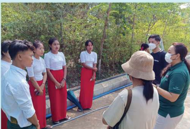
သူနာပြုအကူသင်တန်းသားများနှင့် သွားရောက်တွေ့ဆုံခြင်း

သင်တန်းကျောင်းက အချိန်ပိုင်း သင်တန်းနည်းပြအဖြစ် ပြန်လည်ခန့်ထားသဖြင့် အလုပ်စတင်ဝင်ရောက်နေပြီဖြစ်ပြီး အခြားသင်တန်းသူများအတွက် အလုပ်အကိုင်အခွင့်အလမ်းသစ်များရရှိရေး ဆောင်ရွက်လျက်ရှိသည်။