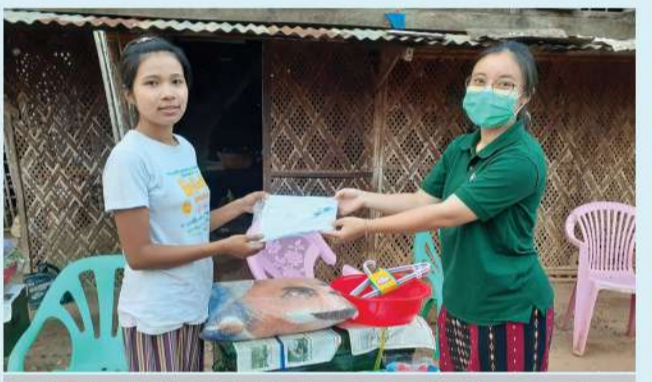
စိုက်ပျိုးရေးသိပ္ပံ (ပွင့်ဖြူ) သို့တက်ရောက်မည့် ပညာသင်ဆုရကျောင်းသားများအတွက် ကျောင်းသုံးနှင့် တစ်ကိုယ်ရေသုံးပစ္စည်းများကို CSR အစီအစဉ်ဖြင့် ပံ့ပိုးခြင်း

အလားတူ ပညာရေးဝန်ကြီးဌာန၊ နည်းပညာ၊ သက်မွေးပညာနှင့်လေ့ကျင့်ရေးဦးစီးဌာနအောက်ရှိ အစိုးရနည်းပညာအထက်တန်းကျောင်း (၃၅) ကျောင်းအနက် မကွေးမြို့ရှိ အစိုးရနည်းပညာအထက်တန်းကျောင်းသို့ ကျောင်းဝင်ခွင့်ရရှိသည့် မန်းရေနံမြေ ဒေသခံလူငယ်များကို MPRL E&P (CSR အစီအစဉ်) ဖြင့်ပညာသင်ဆုချီးမြှင့်ပံ့ပိုးနိုင်ရန် လျှောက်လွှာများဖိတ်ခေါ်ခဲ့ရာ မန်းရေနံမြေထိစပ်ကျေးရွာ (၁၄) ရွာမှ ဒေသခံလူငယ် (၃) ဦး ဝင်ခွင့်ရရှိခဲ့သည်။ အဆိုပါကျောင်းသားများသည် ၂၀၂၂ ဇွန်လမှစတင်၍ နည်းပညာဘာသာရပ်များကို (၃) နှစ်ကြာ သင်ယူရမည်ဖြစ်သည်။