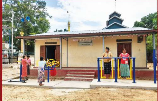
စာမျက်နှာ - ၄ ▶

အထူးသဖြင့် စိန်ခေါ်မှုများနှင့်ပြည့်နှက်နေသည့် အချိန်ကာလတွင် လူတစ်ဦးချင်းစီနှင့် လူမှုအသိုက်အဝန်း တစ်ခုလုံးအတွက် နေ့စဉ်ဘဝအခက်အခဲများမှ ခေတ္တခဏရုန်းထွက်ပြီး မိသားစု၊ မိတ်ဆွေများနှင့် ဆက်သွယ် ပြောဆိုကာ အသိပညာဗဟုသုတနီးနှောဖလှယ်နိုင်မည့် ရင်းနှီးနှေးထွေးသည့် ပတ်ဝန်းကျင်တစ်ခုရှိရန် လိုအပ်ပါသည်။ သို့ဖြစ်၍ အသိပညာဗဟုသုတတိုးပွားရန်၊ အချင်းချင်းဆက်သွယ်ပြောဆိုရန်၊ ကိုယ်လက်လှုပ်ရှား လေ့ကျင့်ခန်းလုပ်ရန်နှင့် အခြားရပ်ရွာအရေးကိစ္စများကို သိရှိပြီးပါဝင်ဆောင်ရွက်နိုင်ရန်၊ ကျောင်းသားလူငယ်များအတွက် ကျောင်းပြင်ပလှုပ်ရှားမှုများတွင်ပါဝင်ဆောင်ရွက်နိုင်ရန် လူထုအခြေပြု ဗဟိုဌာန (Community Center) များကို နိုင်ငံတဝှမ်းတွင် လိုအပ်ချက်မြင့်မားလာခြင်းလည်း ဖြစ်သည်။