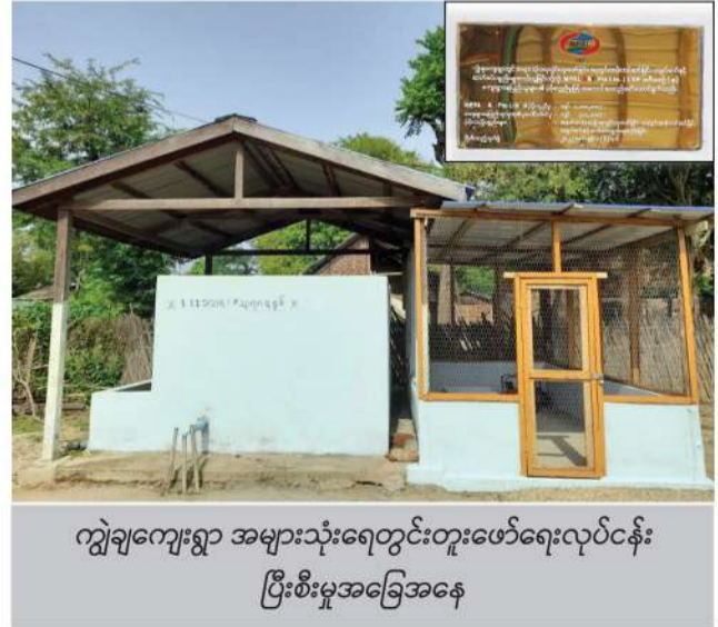
ကျွဲချကျေးရွာ အများသုံးရေတွင်းတူးဖော်ရေးလုပ်ငန်း ပြီးစီးမှုအခြေအနေ

ရွာသာကျေးရွာမြစ်ရေတင်စီမံကိန်းအတွက် ဒီဇယ်အင်ဂျင်၊ ရေစုပ်စက်နှင့် ရေပိုက်လိုင်းများပံ့ပိုးခြင်း