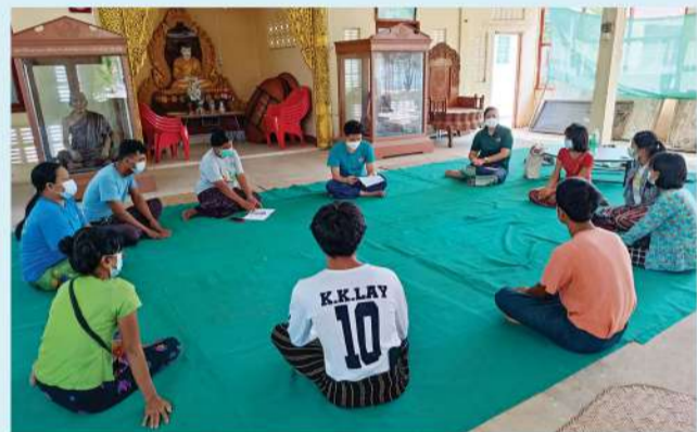
စိုက်ပျိုးရေးသိပ္ပံ (ပွင့်ဖြူ) တွင် သင်တန်းတက်ရောက်မည့် ကျောင်းသားများနှင့် အကြံပြုတွေ့ဆုံဆွေးနွေးခြင်း

MPRL E&P (CSR အစီအစဉ်) ဖြင့် ပံ့ပိုးမည့် ပညာသင်ဆုရ ကျောင်းသားများအနေဖြင့် စိုက်ပျိုးရေးသိပ္ပံ (ပွင့်ဖြူ) တွင် တက်ရောက်ပညာသင်ကြားမည့် ကျောင်းသားများ ကျောင်းတက်စဉ် ကာလတစ်လျှောက်လုံးတွင် သတ်မှတ်စည်းကမ်းများကို သိရှိသဘောတူ လိုက်နာဆောင်ရွက်နိုင်ရန်နှင့် ဘာသာရပ်အလိုက် သင်တန်းပြီးဆုံးသည်အထိ အောင်မြင်အောင် ကြိုးပမ်းလေ့လာနိုင်ရန် ကျောင်းသားမိဘများနှင့် ကျောင်းသားများကို CSR လုပ်ငန်းအဖွဲ့ဝင်များက CSR အစီအစဉ်ဖြင့် ပံ့ပိုးမည့်အစီအစဉ်များနှင့် ကျောင်းသားများလိုက်နာရန် စည်းကမ်းသတ်မှတ်ချက်များကို သိရှိသဘောတူ လက်မှတ်ရေးထိုးစေပြီး ကျောင်းအပ်နှံရေးလုပ်ငန်းများကို ဆောင်ရွက်ခဲ့သည်။