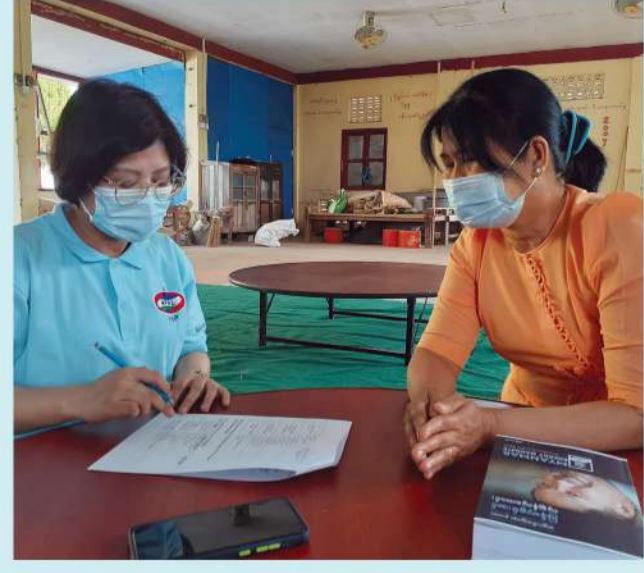
စာမျက်နှာ - ၅ ▶

ပြောင်းလဲဆောင်ရွက်ရမည့် CSR လုပ်ငန်းများကို သတ်မှတ်ဖော်ထုတ်နိုင်ရန် ရည်ရွယ်၍ ၂၀၂၂ ခုနှစ်၊ မတ်လတွင် CSR လုပ်ငန်းဆောင်ရွက်ချက်များအပေါ် ဆန်းစစ်သည့် လေ့လာမှုစစ်တမ်းတစ်ခု ကောက်ယူခဲ့သည်။