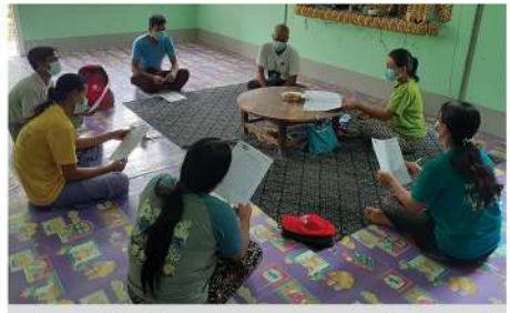
မန်းရေနံမြေထိပ်ကျေးရွာများမှ စေတနာ့ဝန်ထမ်းများနှင့် တွေ့ဆုံ၍ အမှိုက်သိမ်းစနစ်လုပ်ငန်းနှင့်ပတ်သတ်သော အခြေအနေများဆွေးနွေးခြင်း