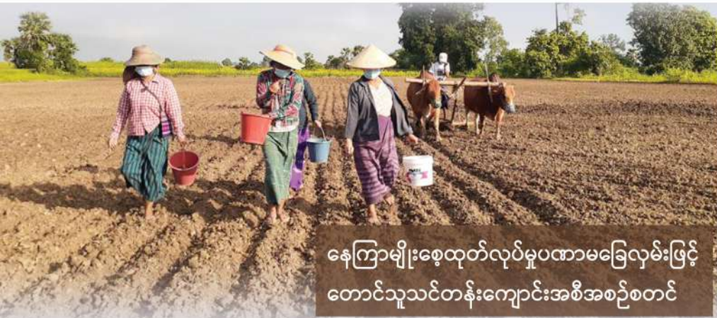
နေကြာမျိုးစေ့ထုတ်လုပ်မှုပဏာမခြေလှမ်းဖြင့် တောင်သူသင်တန်းကျောင်းအစီအစဉ်စတင်

မန်းရေနံမြေမှ တောင်သူဦးကြီးများ စိုက်ပျိုးရေးဆိုင်ရာ နည်းပညာသစ်များကို နားလည်တတ်ကျွမ်းစေရန်နှင့် ဒေသခံများ၏ စိုက်ပျိုးရေးဆိုင်ရာ အခက်အခဲများကို တစ်ဖက်တစ်လမ်းမှ ကူညီဖြေရှင်းပေးနိုင်ရန် ရည်ရွယ်သော တောင်သူသင်တန်းကျောင်းအစီအစဉ် (Farmer Field School - FFS) သည် ၂၀၂၁ ခုနှစ် စက်တင်ဘာလတွင် နေကြာမျိုးစေ့ထုတ်လုပ်ခြင်းဖြင့် ပထမခြေလှမ်းစတင်နိုင်ခဲ့ပြီဖြစ်ပါသည်။