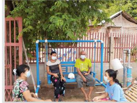
နန်းဦးကျေးရွာစေတနာ့ဝန်ထမ်းနှင့်တွေ့ဆုံခြင်း