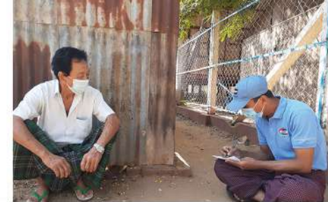
လက်ပံတောကျေးရွာ၌ အမှိုက်သိမ်းစနစ်အပေါ် သဘောထားစစ်တမ်းကောက်ယူခြင်း