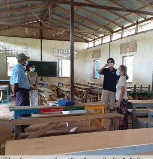
ကြာကန်ကျေးရွာစာသင်ကျောင်းမျက်နှာကျက်တပ်ဆင်ရန်နှင့် ကြမ်းခင်းပြုပြင်ရန် ကွင်းဆင်းလေ့လာဆန်းစစ်ခြင်း

အလားတူ ကြာကန်ကျေးရွာ အခြေခံပညာအလယ်တန်းကျောင်းတွင် လိုအပ်လျက်ရှိသော ကျောင်းပရိဘောဂစည်းများ ပံ့ပိုးနိုင်ရန်အတွက် ကျောင်းအုပ်ဆရာမကြီး၊ ကျောင်းဖွံ့ဖြိုးရေးကော်မတီအဖွဲ့ဝင်များနှင့် ၂၀၂၁ ခုနှစ် စက်တင်ဘာလတွင်တွေ့ဆုံ၍ ကျောင်းအတွက်လိုအပ်သော ပရိဘောဂပုံစံနှင့် အရွယ်အစားကို အတည်ပြုချက်ရယူကာ စုစုပေါင်းတန်ဖိုးငွေ (၁,၀၆၅,၀၀၀/-) ကျပ်ရှိသော အလျား ၆' x အနံ ၃' ကျွန်းစီ (၂) လုံး၊ အလျား ၄' x အနံ ၄' မှန်စီ (၂) လုံးနှင့် အလျား ၄' x အနံ ၃' စာအုပ်စင် (၂) ခု ကို MPRL E&P ၏ CSR အစီအစဉ်ဖြင့် ပံ့ပိုးလှူဒါန်းခဲ့ပါသည်။