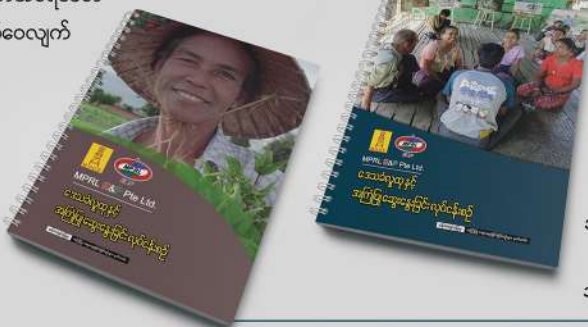
မန်းရေနံမြေ၏ အကြံပြုဆွေးနွေးခြင်းလုပ်ငန်းဆိုင်ရာ သုံးလပတ်အစီရင်ခံစာ

ထို့အပြင် ၂၀၂၁-၂၀၂၂ Contract Year ၏ ပထမခြောက်လပတ် CSR လုပ်ငန်းဆောင်ရွက်ချက်အစီရင်ခံစာကို အင်္ဂလိပ်ဘာသာဖြင့် အစီရင်ခံတင်ပြခြင်း၊ ဒုတိယသုံးလပတ် CSR လုပ်ငန်းဆောင်ရွက်ချက် အစီရင်ခံစာကို မြန်မာဘာသာဖြင့် အစီရင်ခံတင်ပြခြင်းများလည်း ဆောင်ရွက်ခဲ့ပါသည်။