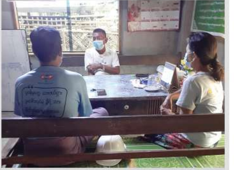
လက်ပံတောကျေးရွာအုပ်ချုပ်ရေးမှူးနှင့်တွေ့ဆုံခြင်း