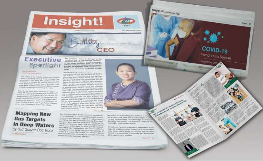
Insight! Newsletter စာစောင် အမှတ် (၂၈)

ထို့အပြင် မန်းရေနံမြေဒေသလူမှုတာဝန်သိလုပ်ငန်းဆောင်ရွက်ချက်များအပြင် MPRL E&P ကုမ္ပဏီအုပ်စု၏ အခြားသော တိုးတက်အောင်မြင်မှုအခြေအနေများကို အင်္ဂလိပ်ဘာသာဖြင့် သုံးလတစ်ကြိမ် ပုံမှန်စီစဉ်ထုတ်ဝေသည့် Insight! Newsletter တွင်လည်း အစီရင်ခံတင်ပြလျက်ရှိရာ ၂၀၂၁ ခုနှစ် စက်တင်ဘာလတွင် Insight! Newsletter စာစောင်အမှတ် (၂၈) ကို ထုတ်ဝေခဲ့ပြီးဖြစ်ပါသည်။