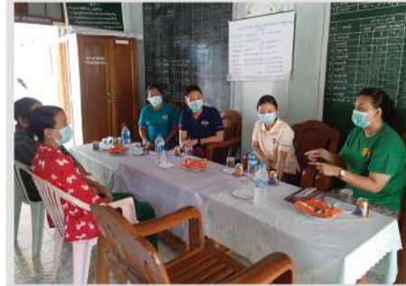
မယ်ဘောကုန်းကျေးရွာကျောင်းအုပ်ဆရာမကြီးနှင့်တွေ့ဆုံခြင်း

CSR လုပ်ငန်းအဖွဲ့ဝင်များသည် မင်းဘူးမြို့နယ်စိုက်ပျိုးရေး ဦးစီးဌာနဦးစီးမှူးနှင့်တွေ့ဆုံ၍ Farmer Field School အစီ အစဉ်အကောင်အထည်ဖော်ရန် ဆွေးနွေးခဲ့သည့်အပြင် မန်း ရေနံမြေထိစပ်ဒေသများအတွက် ရှေ့ဆက်လုပ်ဆောင်မည့် စိုက်ပျိုးရေးကဏ္ဍများတွင် စိုက်ပျိုးရေးဦးစီးဌာနနှင့် MPRL E&P ၏ CSR အစီအစဉ်တို့ ပူးပေါင်းဆောင်ရွက်မည့် အခြေ အနေများကိုလည်း ဆွေးနွေးခဲ့ကြပါသည်။ မြို့နယ်စိုက်ပျိုး ရေးဦးစီးဌာနသို့ တာဝန်ကျသော ဦးစီးမှူးအသစ်နှင့်လည်း CSR ကွင်းဆင်းဝန်ထမ်းများ သွားရောက်တွေ့ဆုံမိတ်ဆက် ခဲ့ပြီး ရှေ့ဆက်လုပ်ဆောင်မည့် စိုက်ပျိုးရေးအစီအစဉ်များ နှင့်ပတ်သက်၍ ဆွေးနွေးတိုင်ပင်ခဲ့ပါသည်။