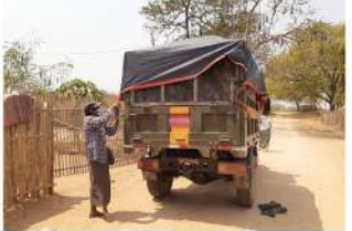
၂၀၂၁-၂၀၂၂ Contract Year ဒုတိယသုံးလပတ်အတွင်း အမှိုက်သိမ်းဝန်ဆောင်မှုပေးလျက်ရှိသည့် မန်းရေနံမြေထိပ်ကျေးရွာများ၏ လုပ်ငန်းဆောင်ရွက်မှု အခြေအနေများကို စောင့်ကြည့်လေ့လာခြင်း